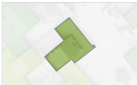
Geschiktheid per gebouw