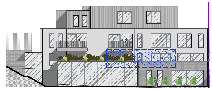
Achtergevel August Vandoorslaerlaan