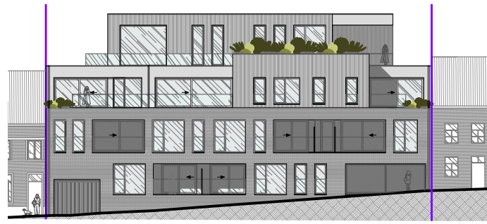
Voorgevel August Vandoorslaerlaan