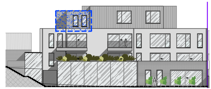
Achtergevel August Vandoorslaerlaan